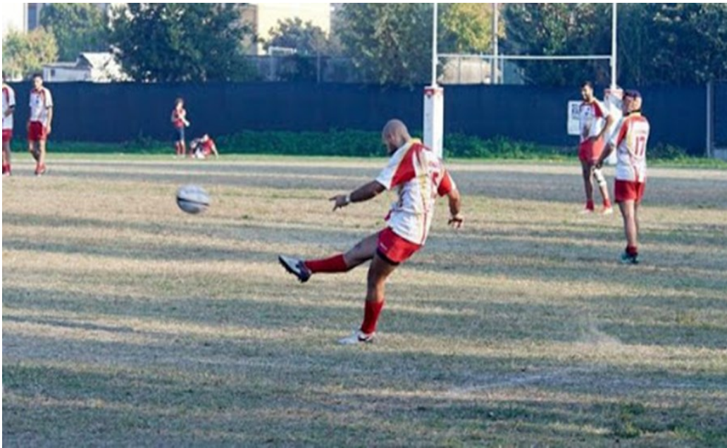
CALCIO DI PUNIZIONE