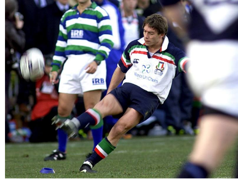
CALCIO DI TRASFORMAZIONE