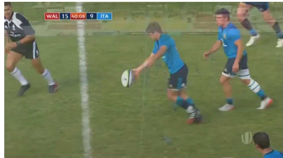
CALCIO DI RINVIO